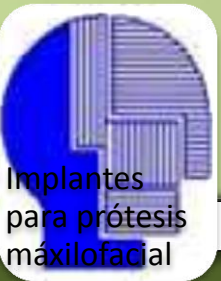
Implantes para prótesis maxilofacial