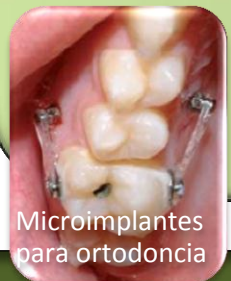
Microimplantes para ortodoncia