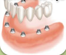
Arcada completa fija