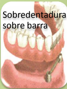
Sobredentadura sobre barra