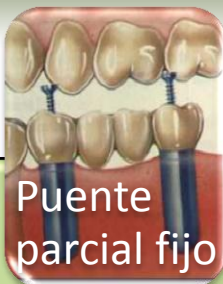
Puente parcial fijo