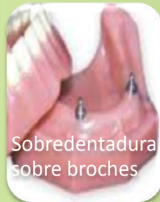
Sobredentadura sobre broches